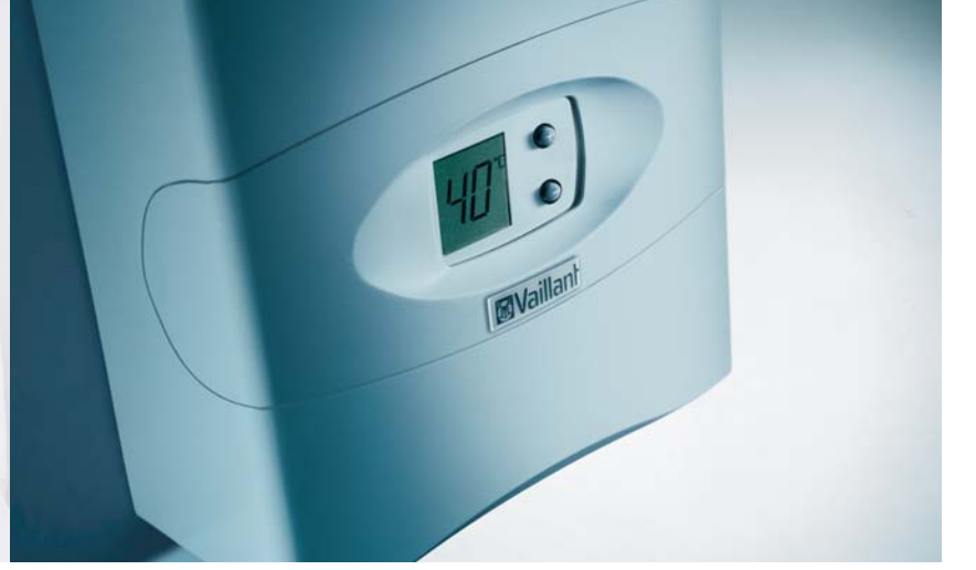
VED Elektrikli Su Isıtıcı